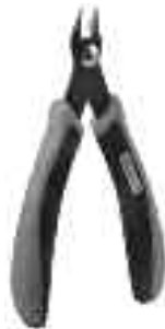
Art. Nr. 170688 Spezial-Seitenschneider

Vloeibare lijm in plastic-flacon met doseerbuisje om nauwkeurig te lijmen.